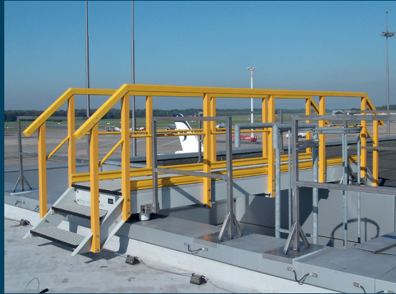
←→ GFK- Konstruktionen